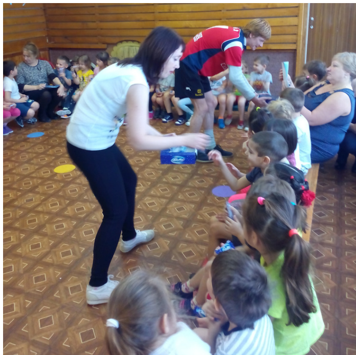
На снимке: угощение малышей после дружной работы в команде

В год 20 - летия в кооперативе "Касса Взаимного Кредита" стартовала акция "20 лет - 20 добрых дел".